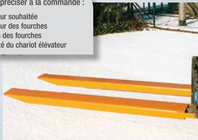
Rallonges de fourches Type GG - Tôle pliée fermée, blocage et arrêt par boulon