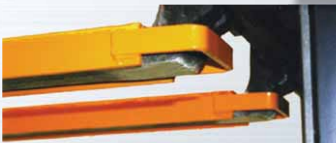
Rallonges de fourches Type GO - Profil ouvert en "U", arrêt par bride